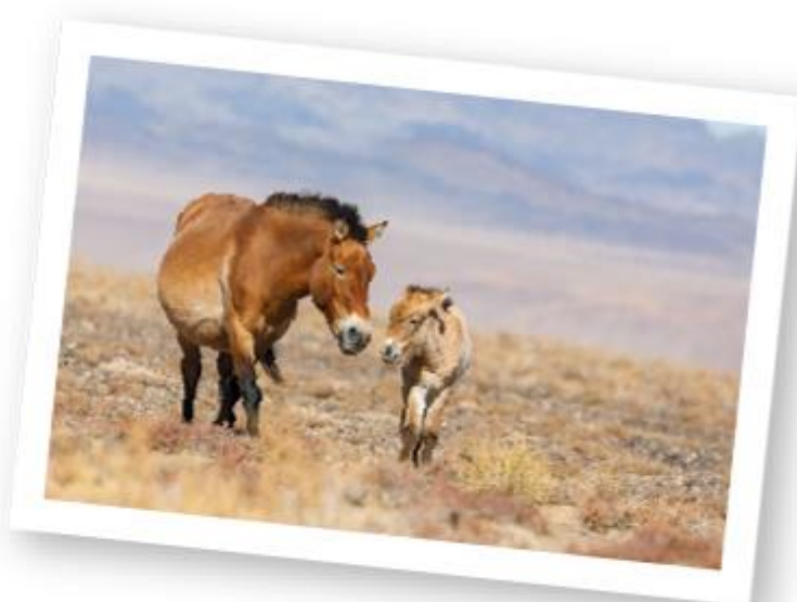
Klisna koně Převalského s hříbětem v lokalitě Tachin tal v Přísně chráněné oblasti Velká Gobi B.

V letech 2011 až 2019 proběhlo devět leteckých transportů koní Převalského do západního Mongolska. Desátý se kvůli covidu neuskutečnil – a skvělá zpráva je, že ani nebude potřeba. Třicet klisen přepravených z Prahy do Přísně chráněné oblasti Velká Gobi nejenže mělo doposud na osmdesát hříbat, ale dočkalo se i jedenácti vnučat a dokonce prvních pravnoučat. Celkový počet koní Převalského v této rezervaci již narostl na dostatečný počet více než čtyř set jedinců. Působení Zoo Praha v Mongolsku tím však nekončí. Její pracovníci připravují ve spolupráci s místními kolegy zcela nový reintrodukční projekt koní Převalského pro východní Mongolsko. V současnosti je již vybrána nejvhodnější lokalita.