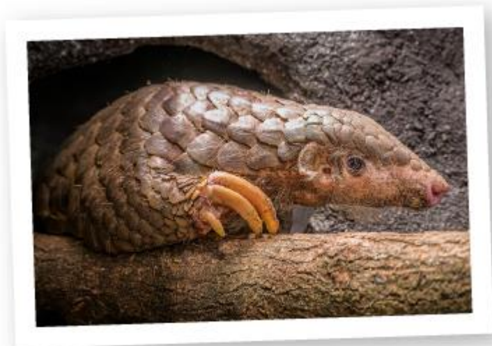
Samec luskouna krátkoocasého Guo Bao v noční expozici pavilonu Indonéska džungle.

tato mimořádně náročná zvířata podařilo zvládnout a že by se právě v Praze mohlo narodit první evropské mládě luskouna.