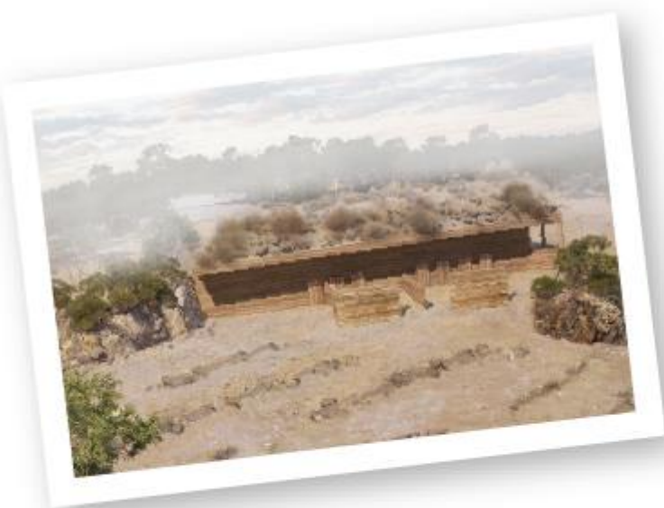
Vizualizace nové podoby hlavního výběhu a zázemí expozice koní Převalského, které má evokovat prostředí Džungarské Gobi.

Poté, co byl v jihovýchodní části tzv. Plání rozšířen vodojem, začala výstavba nových stájí a výběhů koní Převalského, jež doplní expozice manulů a „olgoje chorchoje“. Jde o první etapu přeměny celých Plání, které budou věnovány výhradně asijské fauně. Zoo Praha se tak vrátí mj. k chovu nosorožců, na které se návštěvníci často ptají. Vedle prací na Pláních (a ovšem dokončování Rezervace Dja) probíhala rovněž řada drobnějších stavebních aktivit a v neposlední řadě také příprava na výstavbu expozičního celku Arktida. Ten bude určen zejména pro lední medvědy, jejichž chov by bez vybudování nového chovného zařízení musela Zoo Praha ukončit. Výstavba Arktidy by v ideálním případě mohla začít koncem roku 2023.