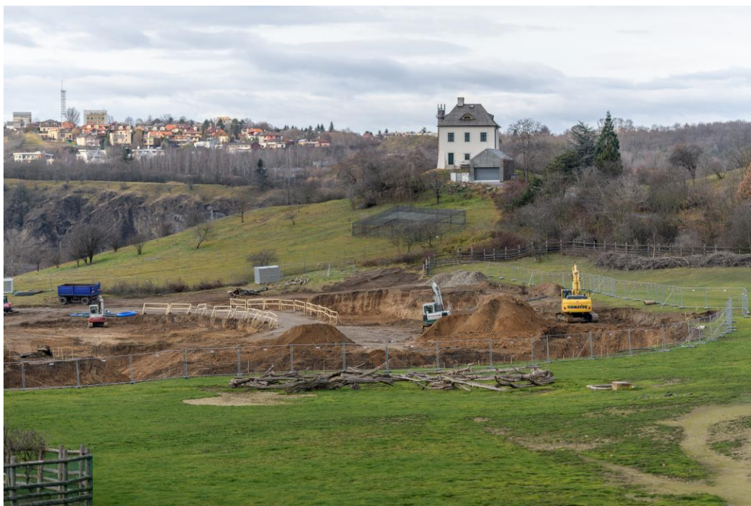
Foto 9: Nový pavilon goril bude zapuštěn do terénu a jeho střecha osazena zelení, proto není třeba se obávat narušení krajinného rázu Trojské kotliny.

Předáním staveniště firmě Strabag začala 29. října 2019 po mnoha letech průtahů, způsobených mj. Městskou částí Praha-Troja, výstavba nového pavilonu goril. Bezprostředním podnětem k zahájení příprav na jeho výstavbu pro nás byla povodeň v roce 2013, která ukázala, že evakuace rodinné skupiny goril ze stávajícího pavilonu je prakticky nemožná. Nový pavilon bude umístěn na opačném konci zoologické zahrady, pod Sklenářkou, a nabídne více prostoru jak gorilám, tak návštěvníkům. Těm by měl evokovat cestu středoafriickým venkovem až do nitra deštného lesa. Zásadním přínosem pavilonu bude i možnost chovat v Zoo Praha vedle rodinné skupiny goril nížinných také skupinu samců a přispět tak k řešení jejich přebytku v evropských zoologických zahradách.