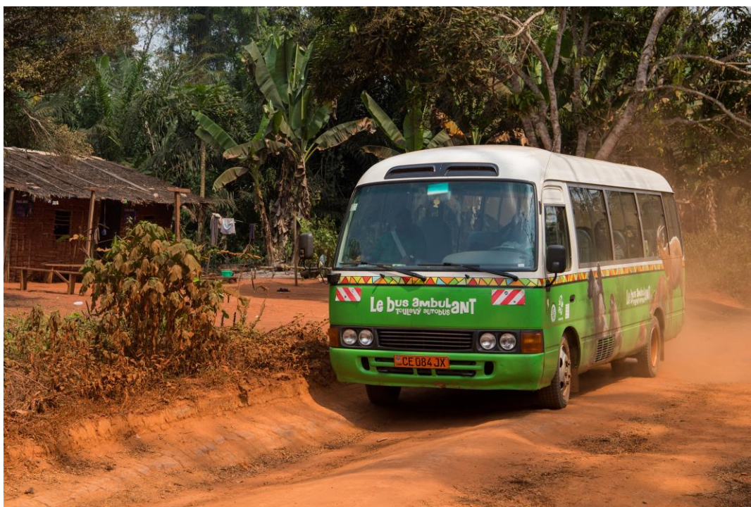
Foto 5: Nový, v pořadí druhý, Toulavý autobus projíždí kamerunským venkovem. Tento projekt opakovaně ocenila jedna z největších osobností světové ochrany přírody Jane Goodall.

Stejně jako v předchozích osmi letech proběhl v roce 2019 letecký transport koní Převalského do Gobi. Počet „převaláků“ přepravených z ČR do Mongolska armádními letouny CASA tak vzrostl na 34. Zoo Praha však realizuje či podporuje celou řadu dalších aktivit na záchranu ohrožených druhů, a to již na pěti kontinentech (Evropa, Asie, Afrika, Austrálie, Jižní Amerika). Jedním z našich profilových projektů je Toulavý autobus, který v Kamerunu realizujeme od roku 2013. Jeho cílem je získat děti z vesnic v okolí rezervace Dja pro ochranu přírody. Na počátku roku 2019 jsme do provozu slavnostně uvedli nový Toulavý autobus, který se od původního liší i programem svých jízd – kromě vzdělávacího programu a výletu za gorilami do Mefou absolvují školáci také exkurze věnované agrolesnictví.