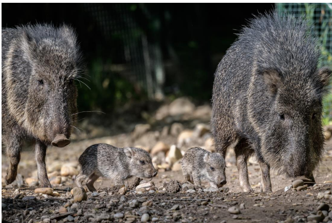
Foto 3: Ohrožený pekari Wagnerův byl popsán nejprve z fosilního záznamu a až do roku 1971 považován za vyhynulý druh.

Celkem se v Zoo Praha za rok 2019 (zcela přesně tedy do odpoledne 31. prosince) narodilo či vylíhlo 1176 mláďat 214 druhů savců, ptáků a plazů. Některá se vzápětí dostala do popředí zájmu médií i veřejnosti – jako například sameček lachtana jihoafrického nebo mláďata lemurů kata –, zatímco jiná zůstala poněkud v pozadí. Přitom mnohé z těchto odchovů jsou z odborného a ochranářského hlediska velice hodnotné. Příkladem mohou být dvě mláďata pekari Wagnerova narozená 4. května 2019. Početnost tohoto druhu čítá v přírodě nanejvýš několik tisíc jedinců a v Evropě ho chová pouze sedm institucí v počtu 45 jedinců, přičemž pravidelné odchovy se daří jen v Tierparku Berlin. Narození pražských mláďat přitom přišlo jen pár měsíců poté, co desítky pekariů v paraguayské chovné stanici podlehly doposud neznámé smrtící chorobě, která patrně sužuje i volně žijící populaci.