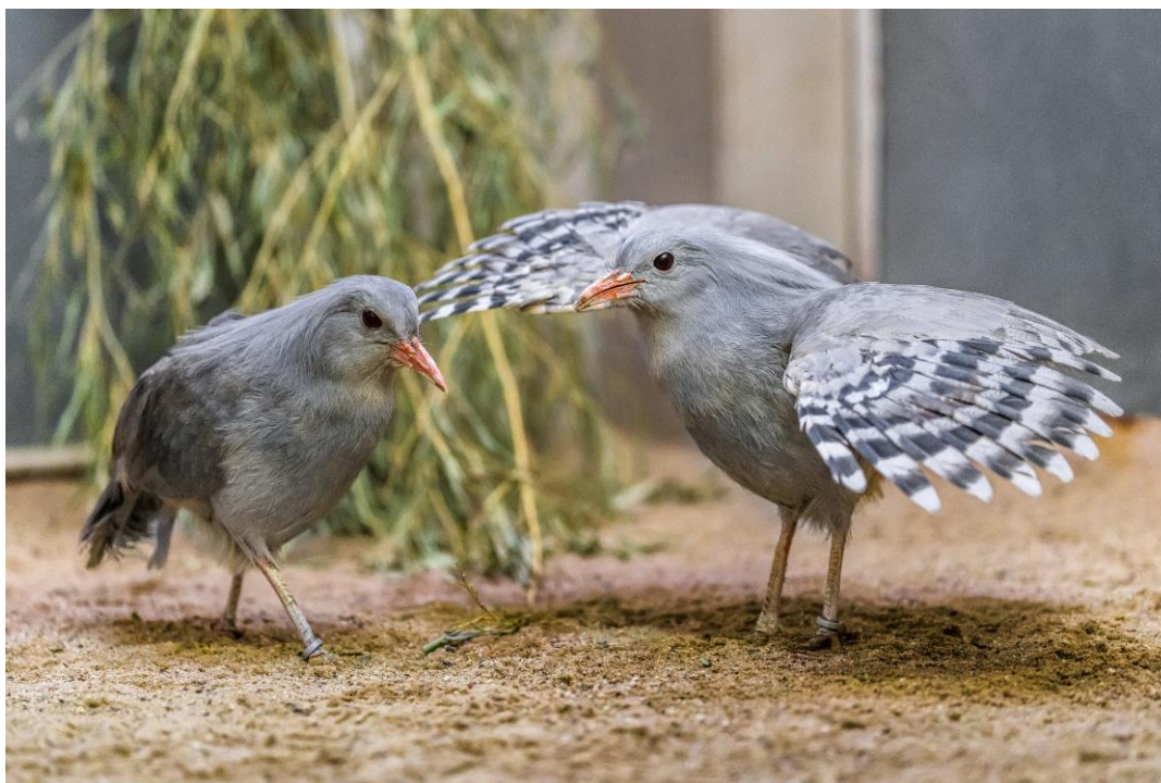
Foto 6: Kagu chocholatý patří k nelétavým ostrovním druhům – stejně jako např. vyhubený dronte mauricijský – a je řazen do zcela samostatné čeledi.

Rok 2019 byl rokem příchodů významných zvířat nejen díky d'áblům medvědovitým, ale také kagu chocholatým, vodnicím posvátným nebo ketupám Pelovým. Endemity Nové Kaledonie kagu chová jen hrstka zařízení a jsou zajímaví jak vzhledem, tak svými projevy. Vodnice posvátné neboli „šourkové žáby“, které žijí v jezeře Titicaca, poskytla Denver Zoo pouze do několika vybraných zoologických zahrad v Evropě. Konečně největší africkou „rybí“ sovu ketupu Pelovu chováme jako jediná zoo na světě. V souvislosti s příchody zvířat musím alespoň zmínit také novou samici tapíra jihoamerického Taluen, která přicestovala až z Francouzské Guyany, a samce hrocha obojživelného jménem Tchéco, který přijel z francouzské zoo v Plaisance-du-Touch, aby nahradil loni uhynulého Slávka.