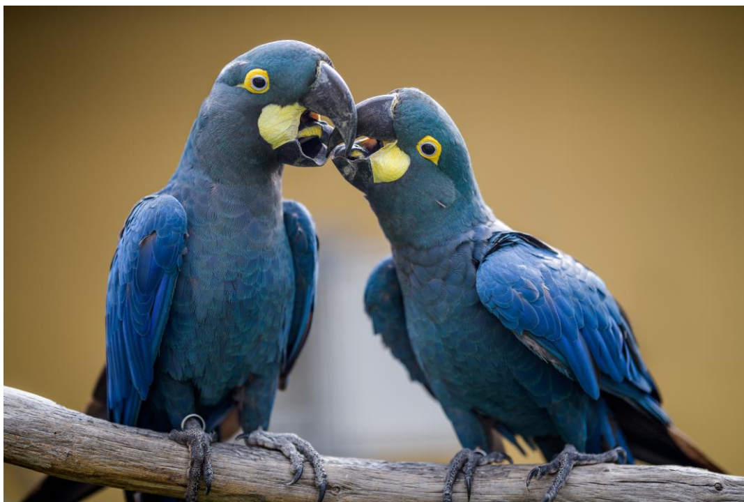
Foto 1: Jeden z nejvýznamnějších obyvatel Rákosova pavilonu – ara Learův. Svě jméno dostal podle slavného viktoriánského autora slavných limeriků Edwarda Leara.

Pavilon pojmenovaný po mecenáši Zoo Praha Stanislavu Rákosovi jsme otevřeli 28. září 2019 a je určen pro nejvzácnější papoušky. Ti se v něm představují v prostředí, které má rostlinstvem, modelací terénu i výmalbou co nejlépe odpovídat lokalitám, kde žijí ve volné přírodě. V pavilonu je vybudováno osm různých biotopů, jež obývají arové Learovi, trichové orlí, madové modrotemenní, amazoňané jamajští, kakaduové palmoví a další druhy. Pavilon vzbudil zájem návštěvníků i zahraničních odborníků a ohlasy od obou těchto skupin jsou veskrze příznivé. Například britská recenzentka Rosemary Low uvedla, že biotop ara Learova v Rákosově pavilonu vypadá tak dokonale, že je na fotografiích k nerozeznání od skutečné scenérie v Brazílii.