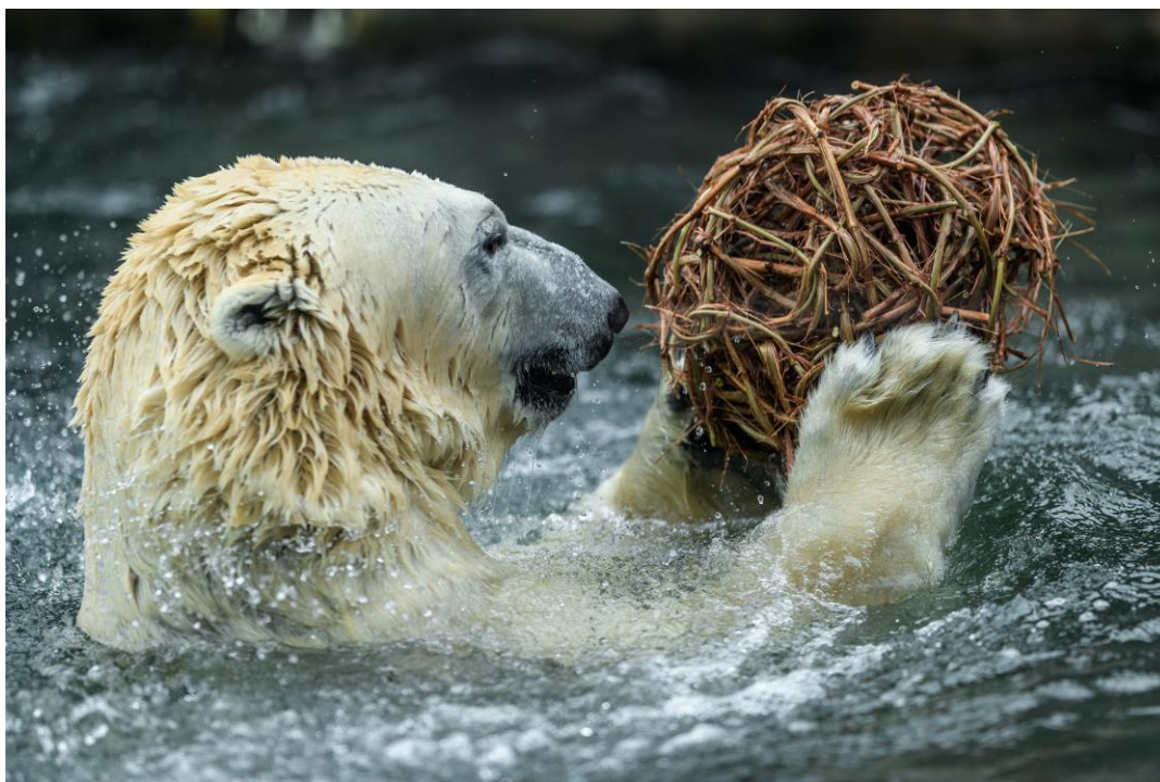
Foto 4: Lední medvěd Tom se věnuje zábavě s koulí spletenou z prutů vinné révy. Pohazuje si s ní a potápí se – až ji nakonec úplně rozcupuje.

Hlavním naším komunikačním tématem byl v roce 2019 enrichment, tedy zpestřování života zvířat a stimulace jejich přirozeného chování. Pod heslem „Zvířata v pohodě“ se promítl do programu v areálu, do obsahu připravovaného pro média a na internet i do outdoorové reklamy. Veřejnost se tak mohla seznámit s nejrůznějšími podobami enrichmentu. Celá řada druhů zvířat dostávala nejrůznější hlavolamy s ukrytou potravou nebo hračky, po výběžích jim byly rozmisťovány kartáče, o které se mohla třít a drbat apod. Lední medvědy až překvapivě aktivizovala vůně bazalky a u goril měl úspěch speciální bublifuk. Na výrobě enrichmentových pomůcek se přitom měli možnost podílet i návštěvníci a tyto aktivity budou nadále pokračovat.