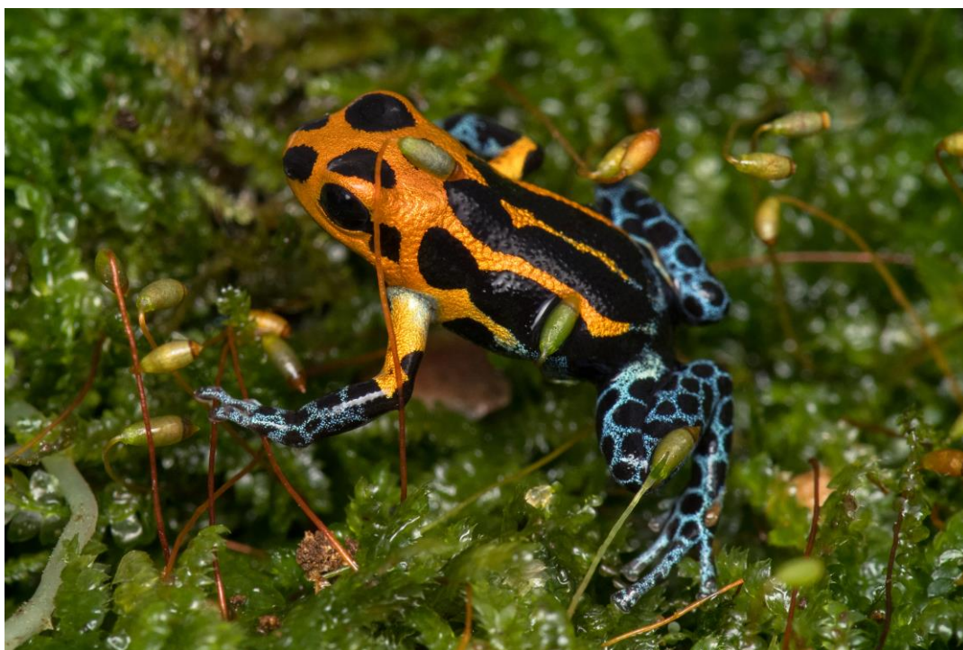
Foto 7: Jedna z nejkrásnějších „šípových žab“ pralesnička fantastická. Stejně jako tomu bylo u jiných výstav v Gočárových domech, mohli se návštěvníci účastnit komentovaných prohlídek.

Z výstav probíhajících na různých místech areálu zoo budí největší pozornost dočasná expozice živočichů v Gočárových domech. Tuto novodobou tradici jsme v roce 2017 započali výstavou sklípkanů, která se již potřetí zopakovala i v roce 2019. Kromě ní a výstavy štírů v tomto roce proběhla také premiérová výstava „šípových žab“. Na ní měli návštěvníci možnost seznámit se s celkem třiceti druhy pralesniček; taková kolekce dosud v Česku nebyla představena a právem sklidila velký úspěch. K vidění byly jak nejjedovatější žaby světa (mj. pralesnička strašná, která představuje nebezpečí i pro člověka), tak jedny z vůbec nejmenších žab (pestrě zbarvené pralesničky rodu Ranitomeya , které měří 10 až 12 mm).