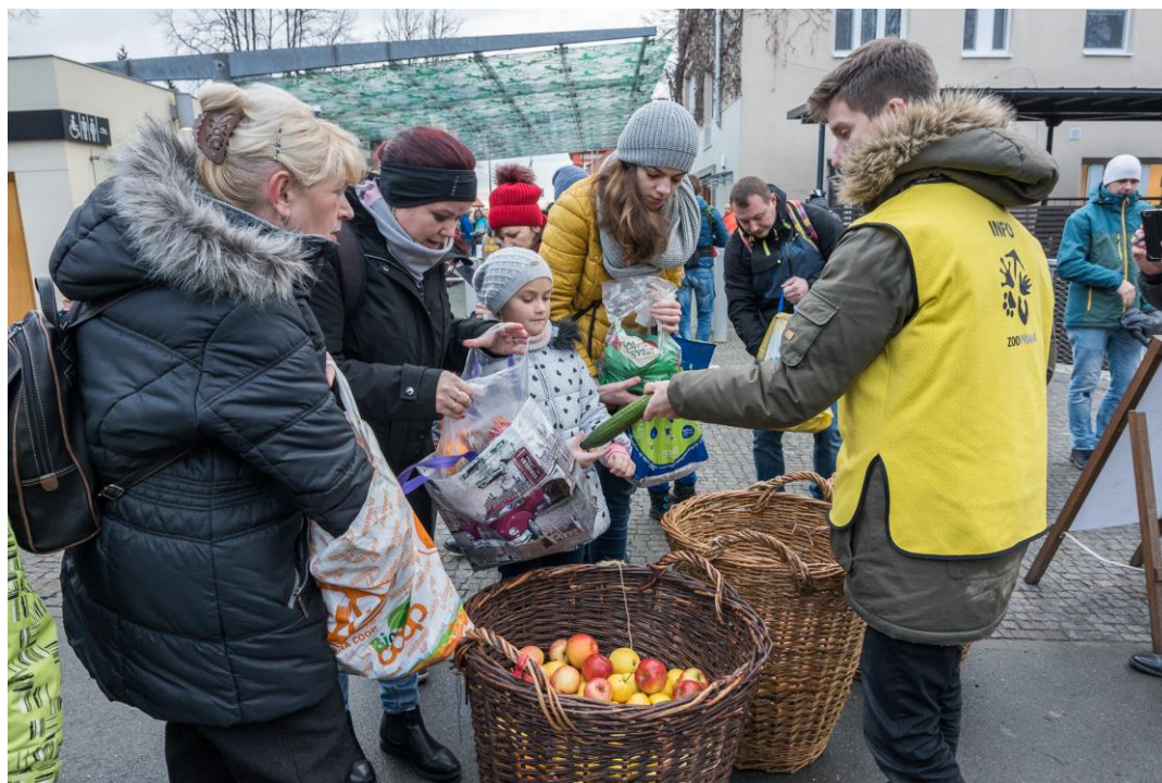
Foto 10: Přízeň návštěvníků Zoo Praha se projevuje mnoha způsoby. K tradici patří i to, že zvířatům přinášejí k Vánocům dárky v podobě ovoce a zeleniny, ořechů nebo suchého pečiva.

Nový návštěvnícký rekord Zoo Praha je nyní definován číslem 1 456 526. Až do Vánoc ovšem nebylo jisté, že dosavadní rekord z roku 2016 skutečně padne. Skutečnost, že se ho i přes handicap zhoršující se dopravní obsluhy Zoo Praha (absence lávky od Stromovky, problémy s příjezdem do Troji i s parkováním) přece jen podařilo překonat, je třeba přičíst otevření Rákosova pavilonu, zvířecím přírůstkům, službám pro návštěvníky i programu v areálu – a zejména neutuchající přízni veřejnosti, které se Zoo Praha dostává. Svědčí o ní i sponzorské dary, adopce zvířat nebo příspěvky na sbírková konta. Například na výstavbu výše uvedeného nového pavilonu goril přispěli příznivci Zoo Praha částkou převyšující 36 milionů korun.